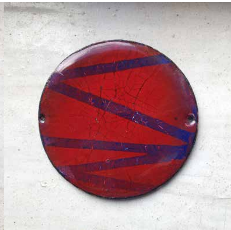
3. Többrétegű karcolt motívumok