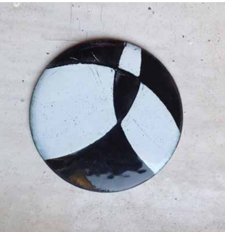
1. Geometrikus alapformák, geometrikus